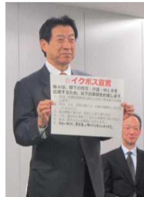
塩崎厚生労働大臣