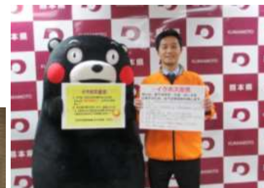
熊本県子ども未来課長