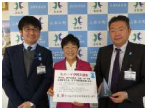
（山梨県北杜市渡辺市長）