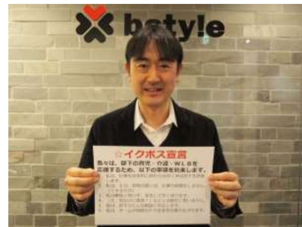
((株)ビースタイル 川上所長)