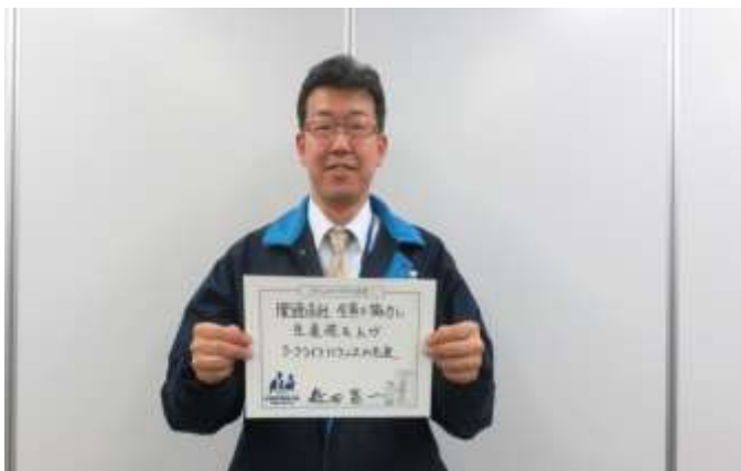
((株)サトーホールディングス 森田関西支社長)