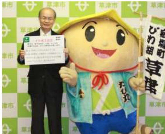
滋賀県橋川草津市長