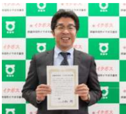
（佐賀県武雄市小松市長）