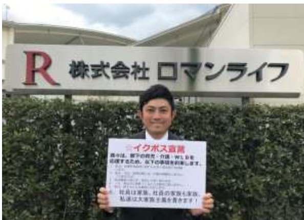
((株)ロマンライフ 河内取締役事業部長)

「今後もさらなる働き方改革の実践と多様な人材の活躍を実現するために、『イクボス』育成の強化に努めます」