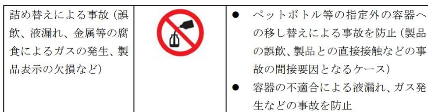
図 「家庭用消費者製品における製品安全表示図記号の使用・適用等に関する自主基準 附属書2 予見される事故に関連する安全図記号及びその防止効果」日本石鹼洗剤工業会 制定年月日：平成28年12月16日

https://jsda.org/w/01_katud/jsda/JSDA_jishukijun_anzenzukigou.pdf