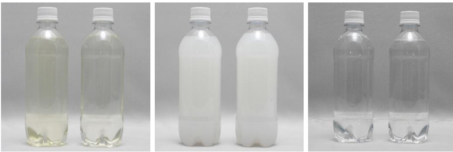
清涼飲料水 洗濯用合成洗剤 清涼飲料水 洗濯用合成洗剤 清涼飲料水 消毒液