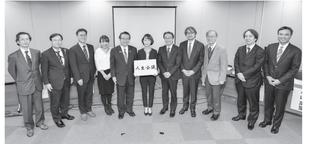
愛称発表会で「人生会議」と発表

ら、前もって人生の最終段階における医療・ケアについて考える機会を持ち、本人が家族等や医療・ケアチームと繰り返し話し合うプロセスを重視した「ア