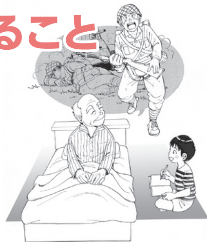
マンガ: あおきてつお © ピエゾコミック