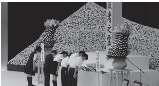
献花する青少年代表