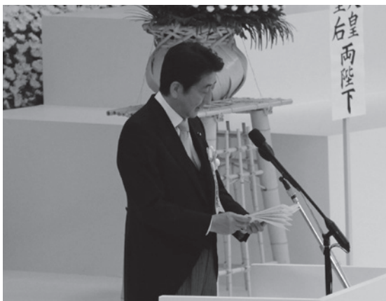
式辞を述べる安倍晋三内閣総理大臣