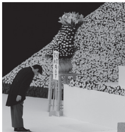
献花する塩崎恭久厚生労働大臣