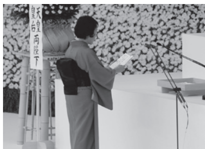
追悼の辞を述べる遺族代表

つつ、戦禍に倒れた戦没者の方々の尊い犠牲があったことに思いを致し、全国民が深く追悼の誠を捧げるとともに、恒久平和の確立への誓いを新たにしようとするものです。