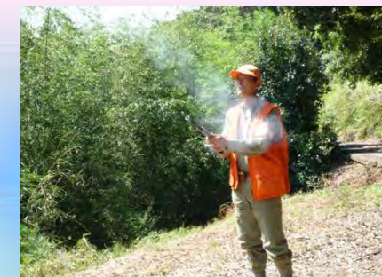
【和歌山県日高川町】 有害鳥獣対策