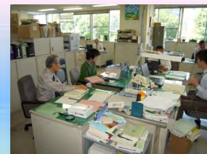
【長野県】障害者の就業支援