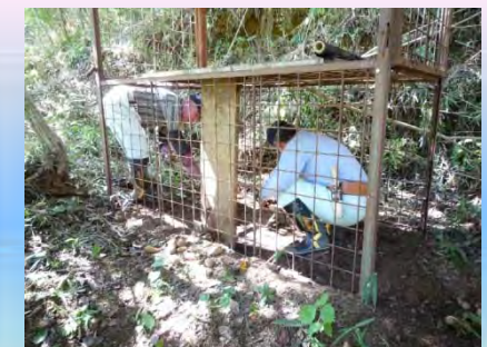
【栃木県】イノシシ捕獲体制の強化