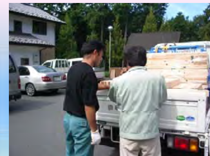
【埼玉県】授産施設の販路拡大