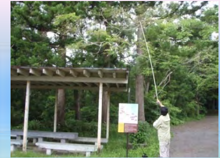
【岩手県久慈市】マイマイガの早期駆除