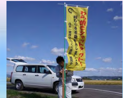
【青森県】 わら焼き防止対策