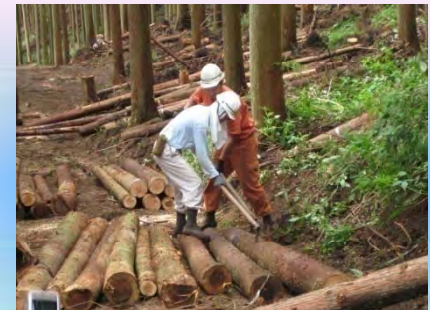
【静岡県浜松市】 山林における残材の搬出