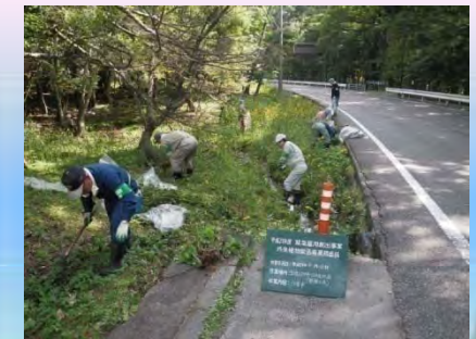
【栃木県】外来植物の抜き取り作業の状況