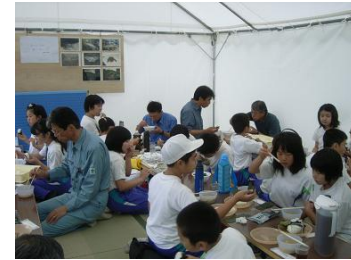
環境調査の後の楽しい昼食