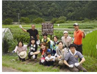
土☆コミュニケーション農園