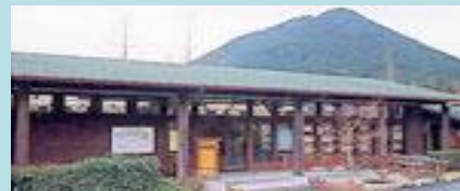
県立近江富士花緑公園