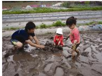
子どもと泥んこ遊び