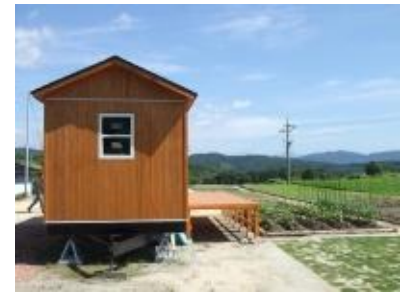
抜群のロケーションのモデル農園