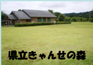
県立きゃんせの森

(ア)山門水源の森(伊香郡西浅井町) : 2人 (イ)県立きゃんせの森(米原市) : 1人 (ウ)県立近江富士花緑公園(野洲市) : 2人