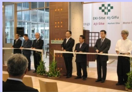
テープカットセレモニー

新たなスタッフと共に、この 岐阜駅周辺地域がにぎわい のある街となるよう頑張ります。