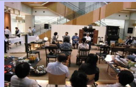
チームMERgEミーティング