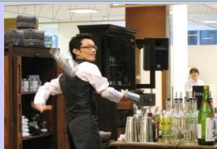
フレアバーテンダーショー