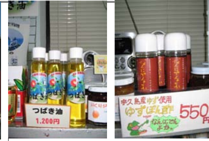
当事業を活用し様々な特産品を開発