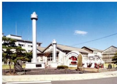
国内で初めてアンモニアを生産したカザレ式合成装置