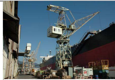
貴重な産業遺産である佐世保重工業