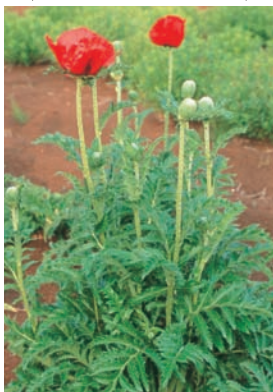
ハカマオニゲシ (植えてはいけない)