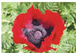
ハカマオニゲシ (植えてはいけし)