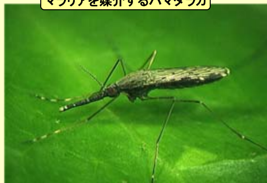
マラリアを媒介するハマダラカ