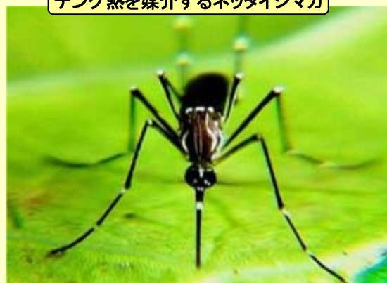
デング熱を媒介するネッタイシマカ