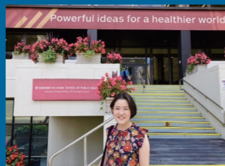
ハーバード大学公衆衛生大学院 医療政策専攻

留学で培った知識と経験を生かし、日本の薬事行政において、より効果的な政策の立案と実現に貢献していきたいと考えています。