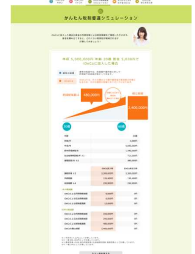
●iDeCoの税制メリットを体感することができます