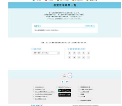
●iDeCo運営管理機関を検索できます

『アプリの紹介』『よくあるご質問』『用語集』『リンク集』『ご相談・問い合わせ』ページ等も搭載