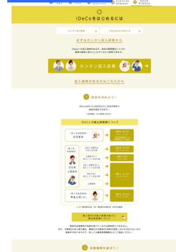
●iDeCo加入までのステップを掲載