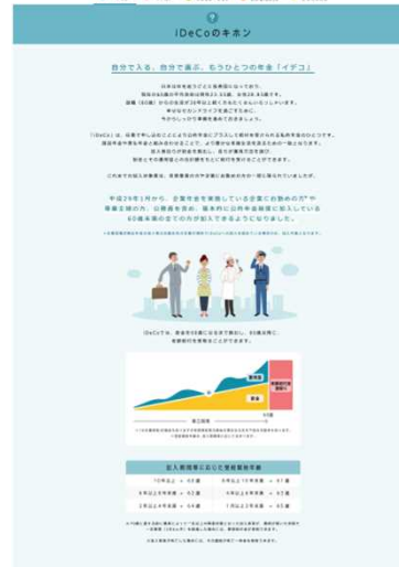
●iDeCoの制度概要を説明