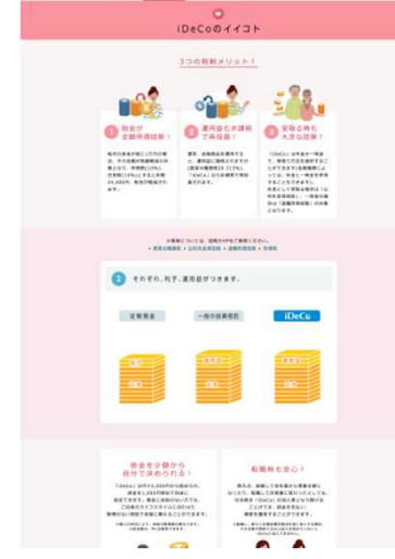
●iDeCoのメリットをイラストやグラフで紹介