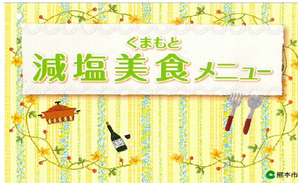
くまもと減塩美食メニュー