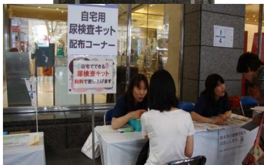
糖尿病学会イベント