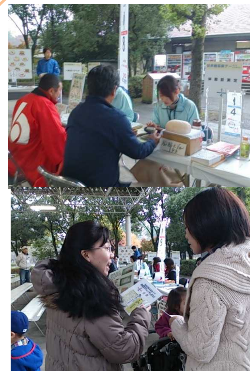
動物園でのイベント