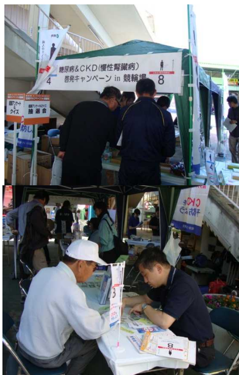
競輪場でのイベント