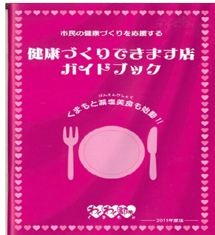
健康づくりできます店ガイドブック