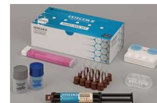
(ペースト、オート ミキシングタイプ)