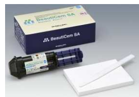
(ペースト、ハンド ミキシングタイプ)