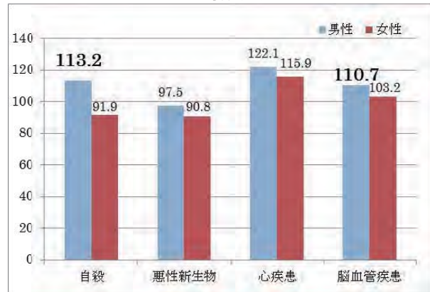
図 1 平成 20-24 年宇和島保健所 SMR