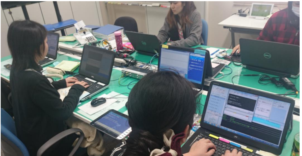
図3 入力中のセンターオペレータ