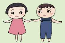
つなガール・さきエール

話をよく聞き、一緒に考えてくれるゲートキーパーがいることは、悩んでいる人の孤立を防ぎ、安心を与えます。