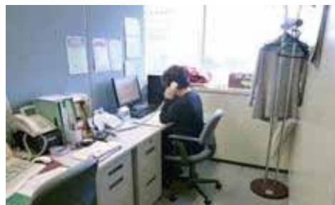
不眠電話相談の相談件数 (H23. 4 月～H24. 1 月)