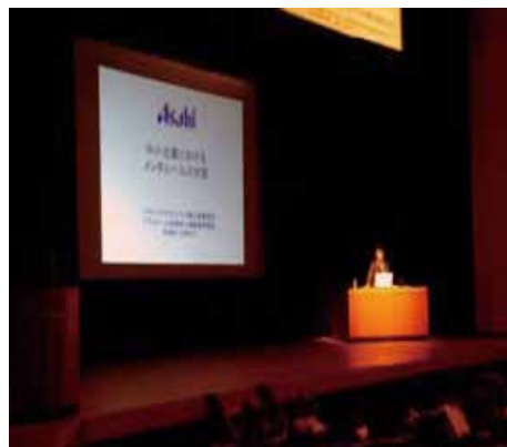
久留米市において開催された自殺予防企業セミナーの様子