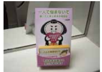
(各種相談窓口を記載した相談先カード)

自殺防止対策の検討を行うほか、事例検討などとおして、それぞれの機関が持つノウハウや相談実施体制を知ることができ、相談ネットワークの構築に役立てることができた。また机上の議論だけではなく、具体的に活動する部会を目指し下記の事業を実施した。