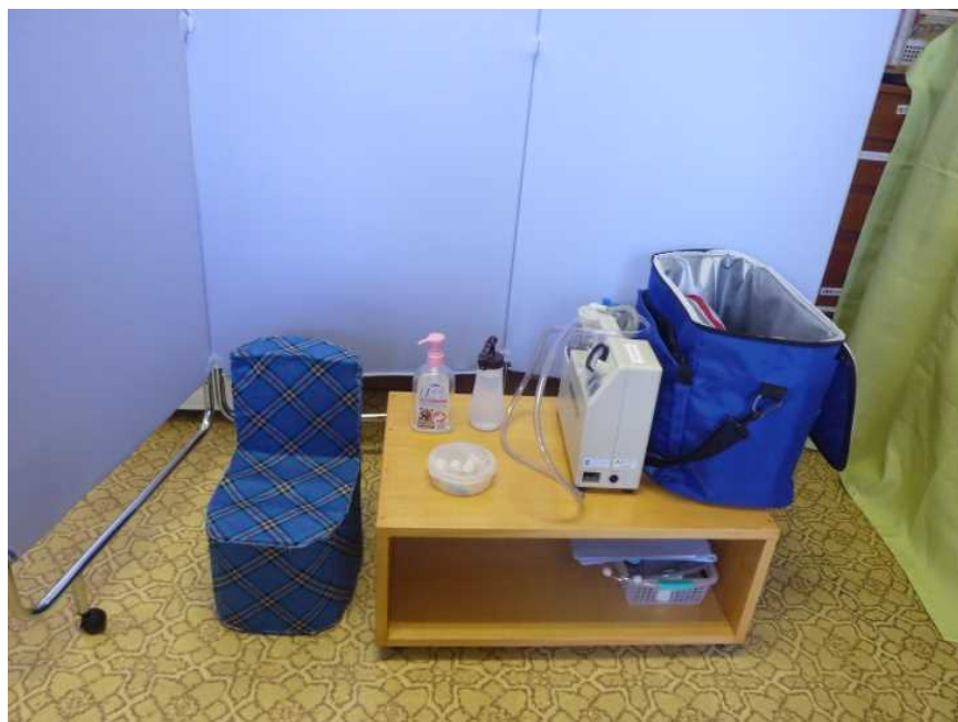
喀痰吸引を行う卓上型吸引器等 (保護者持参)