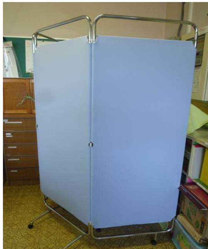
喀痰吸引を行うためのコーナーを 設置(事務室内)