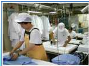
白衣・制服・作業着