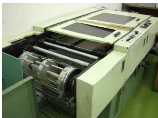
印刷インク拭き用