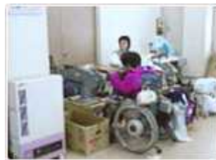
ウエスの裁断作業