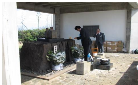
天山慰霊前式典における献水の様子