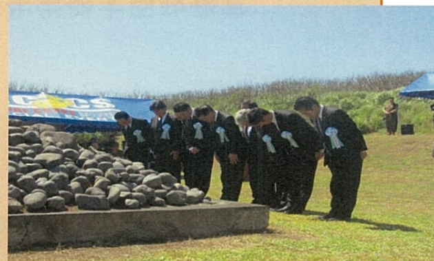
(平成27年度(71周年)式典)