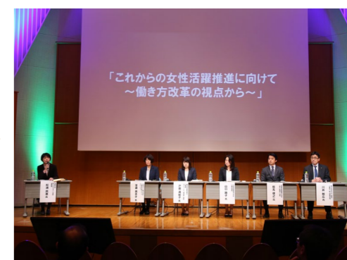
厚生労働大臣優良賞受賞企業によるパネルディスカッション