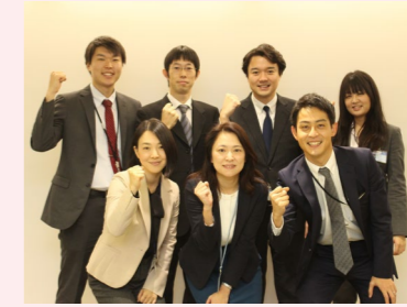
人事部 ダイバーシティ推進担当の皆様

いき」と働くことが不可欠であるため、今後も社員一人ひとりが「いきいき」と働き、自らの力を最大限に発揮出来る環境の整備に全力で取り組んで参ります。