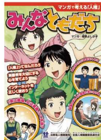
啓発冊子 「みんなともだち マンガで考える『人権』」