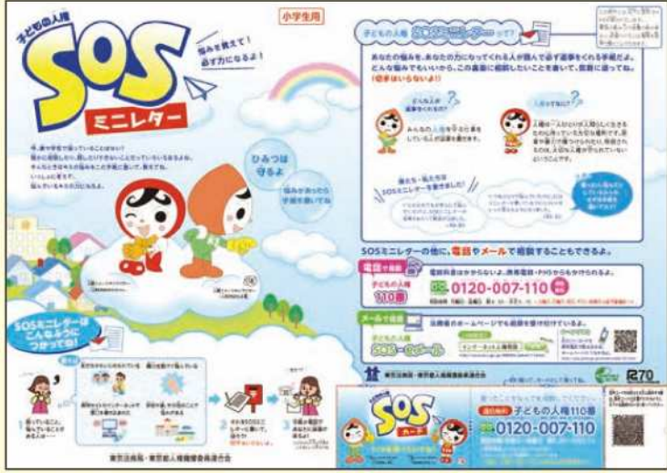
子どもの人権SOSミニレター

集計期間: 平成27年4月1日 ～平成28年3月31日 集計対象: 全国の小・中学校の児童・生徒から寄せられた子どもの人権SOSミニレター