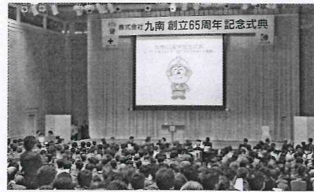
創立65周年記念式典（平成25年9月7日）

企業名 株式会社 九南 職 種 電気工事業、電気通信工事業、管工事業、土木工事業、建築工事業 所 在 地 宮崎県宮崎市大字赤江2番地（本店） 従業員数 360名