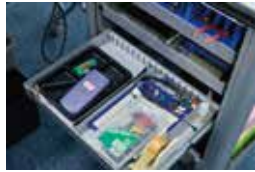
電子機器組立て作業の実施風景