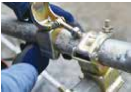
とび作業の実施風景