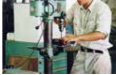
機械組立仕上げ作業