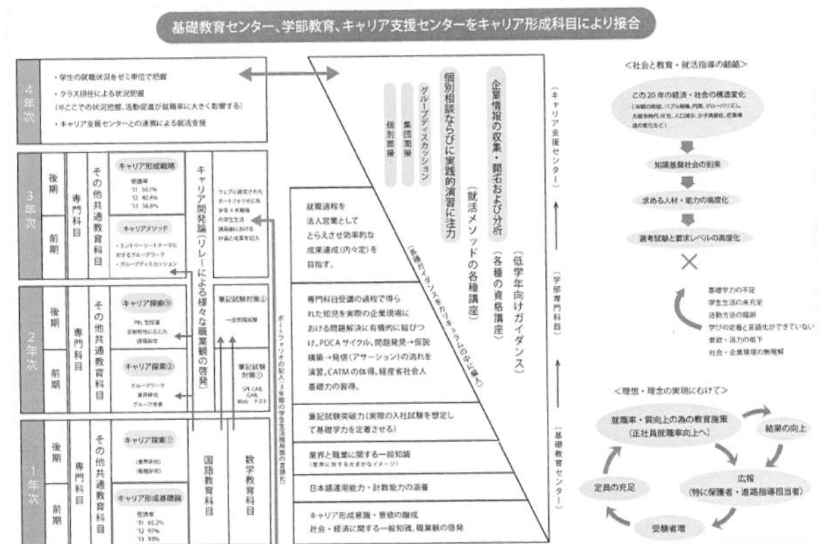
図表 キャリア形成科目による基礎教育センター・学部教育・キャリア支援センターの接合