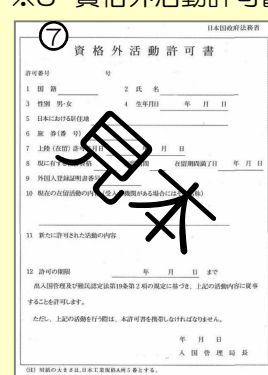
※3 資格外活動許可書