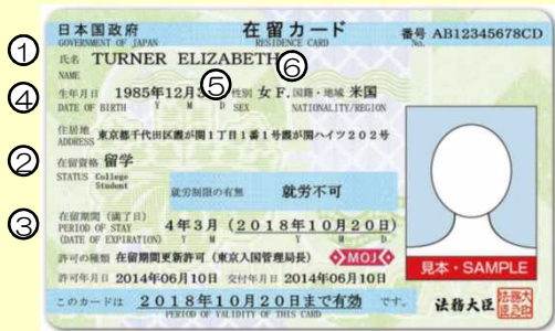
在留カード例（表面）