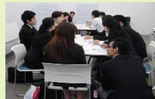
●情報誌掲載企業と求職者の「交流会」

上記で、養った知識やスキルを活かす場として、合同企業面接会を大・中15回開催。参加企業についても、「就活ガイド掲載企業」又は「地域金融機関や経済団体等」と、企業選定を行った上で、安心して応募ができる機会を多く提供する。また、面接突破力をアップさせるため、面接会参加事前予約特典として事前に面接突破力向講座（模擬面接講座）などを実施。面接会を通じ、事業に参加いただいている企業に安定就職ができる仕掛けを行っている。