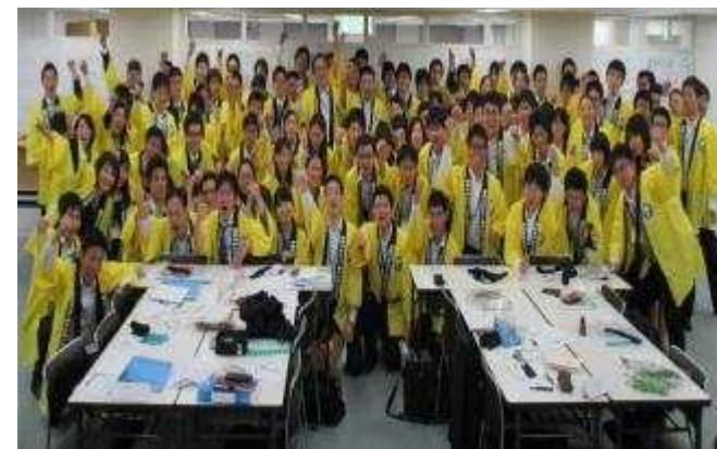
神奈川はたらくみらいカンパニー社員の皆さん

【正規雇用に向けた就業支援】県内中小企業等を中心に求人開拓を行い、事業参加者とのマッチングを支援する。