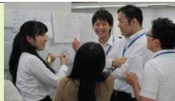
ロールプレイングの様子（OFF-JT研修）

また講義形式の研修だけでなく、「伝える力・営業力」等を育成するロールプレイング形式の研修も実施します。