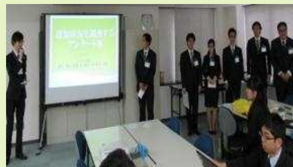
社内プレゼンの様子（OJT研修）

いずれのOJT業務も事業参加者自らが考え行動することで、実際の企業でも通用する力を育成します。