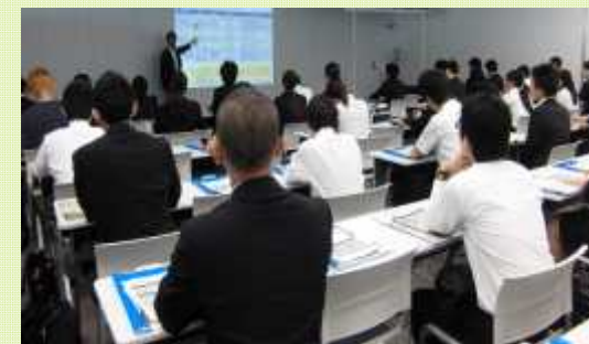
●求職者向け「中小企業理解促進セミナー」

交流会やセミナーを通じ、中小企業の魅力を「関西優良企業就活ガイド2015」を教材等に使用しながらPR。具体的な中小企業ならではの働き甲斐や魅力など理解を深めていく。その上で、掲載企業に多く参加いただき、「求職者」や「経営者・若手社員」の交流会を行うことにより、直接企業の魅力に直接触れ、面接会につなげて、安定就職に繋げていく。