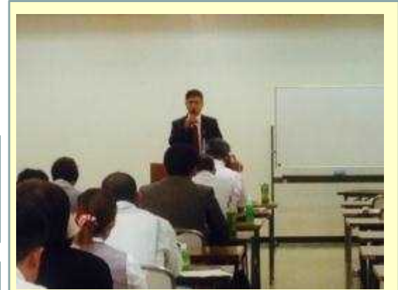
※雇用管理研修の様子