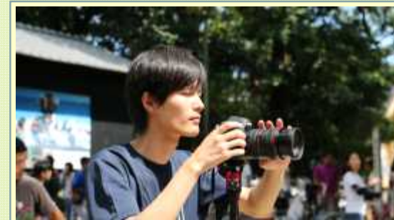
【実習】 地域イベント取材実習