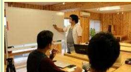
【座学】 動画撮影技術講習の風景