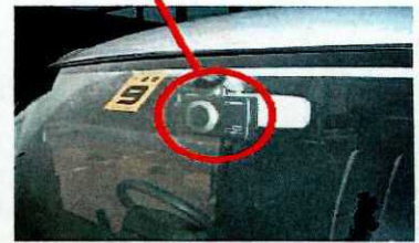
ドライブレコーダー