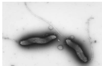
カンピロバクターの電子顕微鏡写真