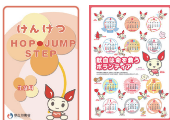
図2-3 「けんけつ HOP STEP JUMP」(左)、中学生用ポスター(右)