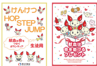
図2-3 「けんけつ HOP STEP JUMP」(左)、中学生用ポスター(右)

また、国、地方公共団体及び日本赤十字社では、小中学生の段階から献血に関する知識の普及啓発を目的とした「キッズ献血(模擬献血)」などを行っています。なお、はばたき福祉事業団による、幼児向けの絵本「ぼくの血みんなの血」や厚生労働省ホームページの「けつえきのおはなし」など、幼少児期からの取組も行われています。(図2-4)