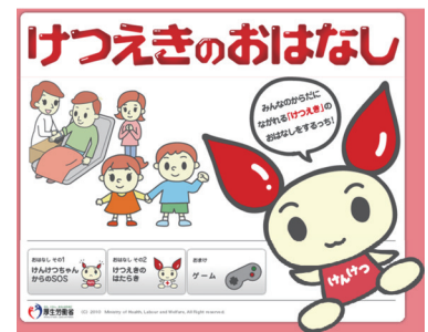
図2-4 けつえきのおはなし

厚生労働省では、平成17年度に献血構造改革として、将来の献血を支えていただける若年層の方々が安定的にかつ持続的に献血を支えていく体制を構築するとともに、血液の需給安定及び安全性向上の観点から、複数回献血者の確保を進めることとし、5年にわたり、組織的な献血推進活動に取り組んでまいりました。(図2-5)