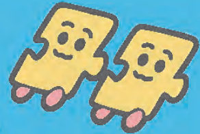
血小板のばんちゃん