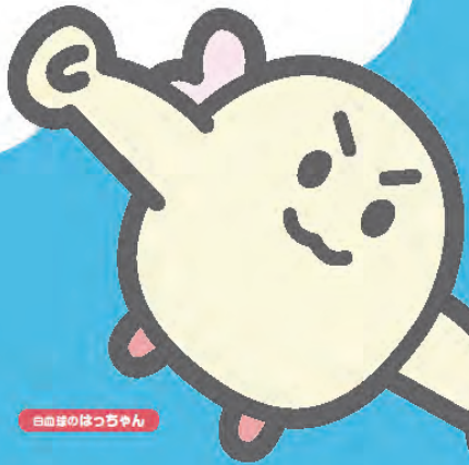
白血球のほっちゃん