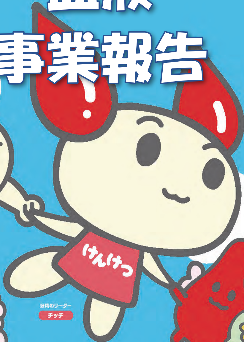
妖精のリーダー チッチ