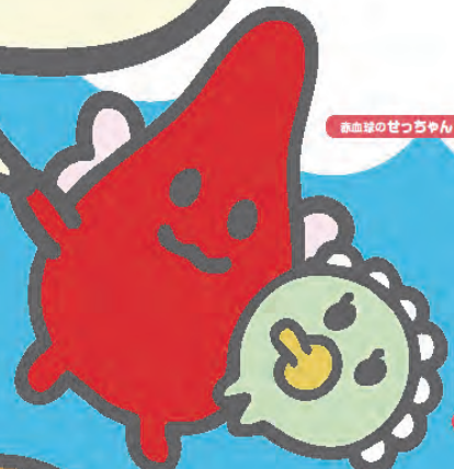
赤血球のせつちゃん