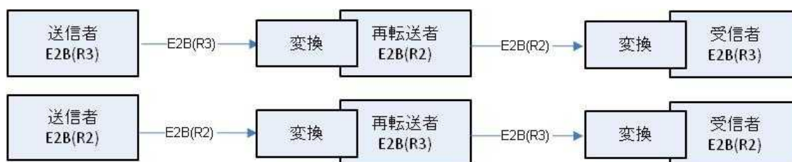
図 2 : 再転送の使用事例

このような場合、変換において、できる限りデータの完全性を保証しなければならない。すなわち、情報の消失がわずかであることが求められる。再転送者によって情報が更新される場合を除き、理想的には最初のメッセージと転送されるメッセージは内容に関して同一であることが必要である。