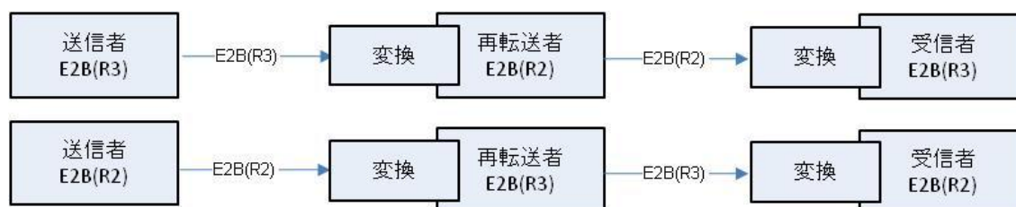
図 2：再転送の使用事例

このような場合、変換において、できる限りデータの完全性を保証しなければならない。すなわち、情報の消失がわずかであることが求められる。再転送者によって情報が更新される場合を除き、理想的には最初のメッセージと転送されるメッセージは内容に関して同一であることが必要である。