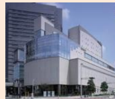
プリランテ武蔵野