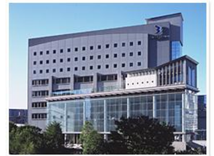
さいたま新都心のホテル