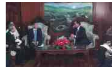
ラオス公共事業省ブンチャン大臣表敬