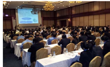
水道セミナー会場