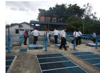
急速ろ過の既設浄水場視察