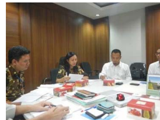
インドネシア公共事業省との協議