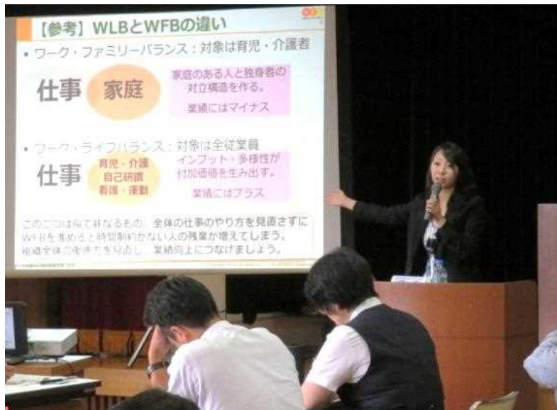
職場リーダー養成講座 平成29年8月1日・山口県社会福祉会館