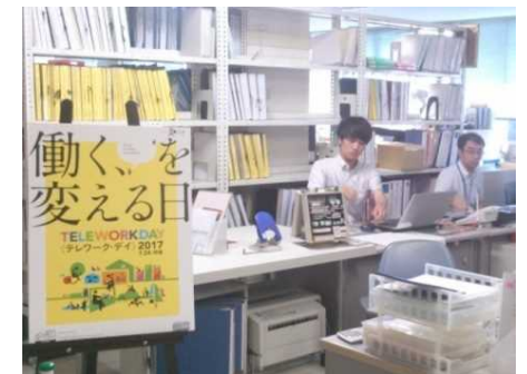
テレワーク・デイ (サテライトオフィス) 平成29年7月24日・山口県防府総合庁舎