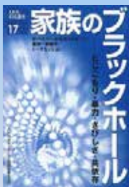
家族のブラックホール とじこもり、暴力、さびしさ、共存 依存 (AKK 市民講座 17) 4500円 500円