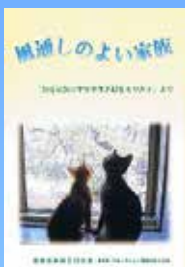
風通しのよい家族 「なぜ家族の中で事件が起きるのか？」より 840円

第28回 AKK 市民講座「こころの痛みと向き合う～家族、それぞれの回復」より 1,500円(会員1,200円)