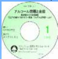
AKK 講演 CD1 アルコール問題と自説

第28回 AKK 市民講座「こころの痛みと向き合う～家族、それぞれの回復」より 1,500円(会員1,200円)