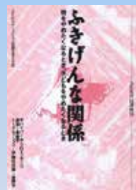
ふきげんな関係 親をやめたくなるとき、子どもをやめたくなるとき (AKK 市民講座 16) 4500円 500円