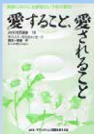
愛すること、愛されること 家族にはびこる愛情という名の暴力 (AKK 市民講座 18) 4500円 500円