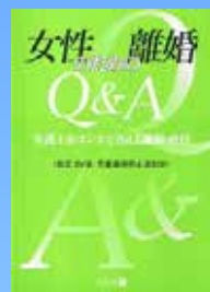
女性のための離婚 Q&A 改訂版 弁護士がホンネで答える離婚・虐待 (<改正 DV 法・児童虐待防止法対応>) 4200円 500円