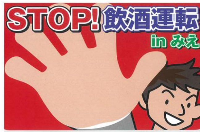
メッセージカード