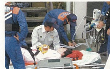
呼吸器と容態の確認