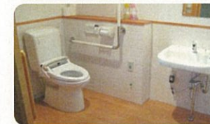
ユニット内の共有トイレ