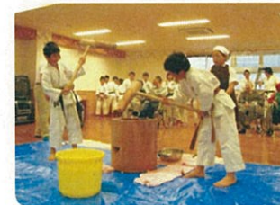
次世代へ受け継がれています