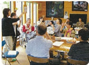
手話を覚えながら 障害についても学びます