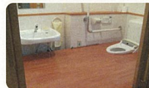
共有の座敷トイレ