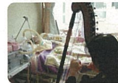
ハーブの心地よい音色を楽しみます