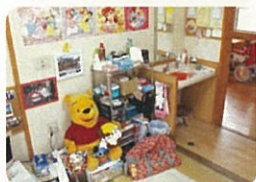
ディズニーキャラクターが大好き!