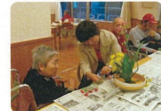
生け花から広がる交流