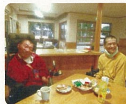
「外出は自由です」 「部屋は自分で決めました」

「部屋の広さは十分か」など、自己選択・決定できる環境であるかを問う質問が多かった。入居者の皆さんは、「自由である」「収入を考えて部屋を選んだ」などと答えていた。