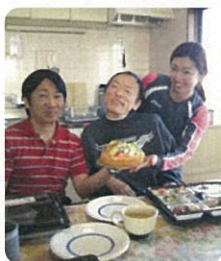
在宅生活、チャレンジ中！