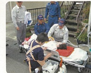
訓練中のたんの吸引