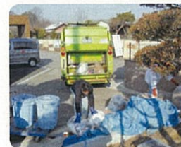
敷地内に収集車が入ってきます