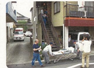
外階段を避難搬送中