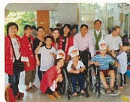
8区に通所施設ができ始める 2014年 利用者が多く、午前・午後の2部制