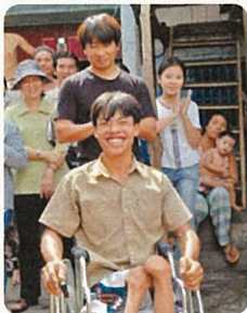
車いすを喜ぶ青年 2003年 これまでは板にキャスターを付けた台にうつ伏せ、地面を押して移動していた