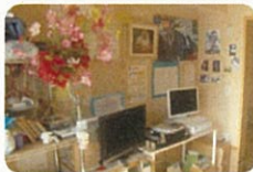
一口馬主の日曜午後は 中継が楽しみ