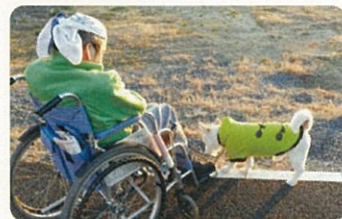
アイドル犬の散歩は代わるがわる