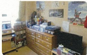
年に1度「鉄人」に会いに 新長田駅前へ