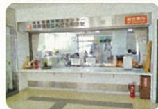
相談室と事業所の連携が圏域を支える

現在、基幹型相談支援センターを中心に8か所の相談支援事業所が連携して、渋川広域圏の障害者福祉サービス等を支えている。