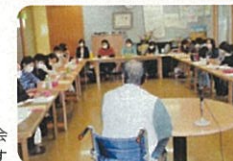
難病ヘルパーの講習会 障害のことや思いを伝えます