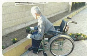
丹精込めた花が皆が和みます