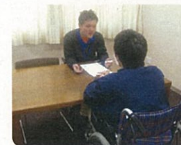
車いすのカウンセラーが、経験を伝えながら「決める」「解決する」をサポートします