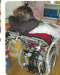
パソコンに脳波を伝えて 意思表示します