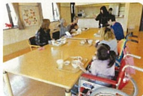
皆で食事。いろいろな話をします