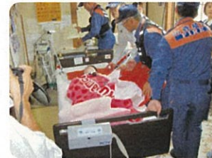
居室（2階）で避難準備

平時に、有事を想定した訓練と情報の共有、支援ノウハウの蓄積を地域ネットワークで行うことを大切に考える。