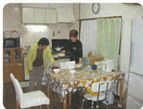
「やってみよう」。体験入居後ケアホームへ

「チャレンジできる」ことは、共生社会の実現につながる。チャレンジすること、リスクを冒して自己実現しようとするところから生まれる、生活の「豊かさ」（地域住民とのつながりなど）が、利用者や、障害者支援施設と地域とで支えることになる。