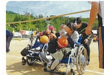
地域の運動会に参加