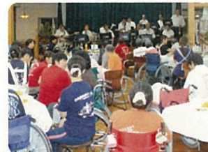
住民結成のビッグバンド。演奏を楽しむ