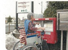
正門脇ポスト 近隣の方も利用します