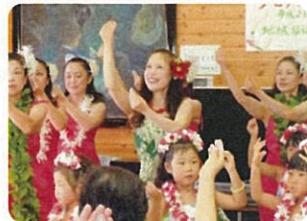
地域の有志が フラダンスで伝える愛