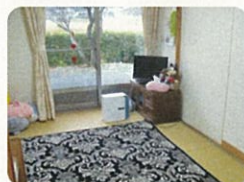
寝具はふとん 好きな生活スタイルを選択