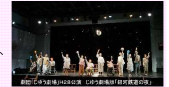
劇団「じゆう劇場」H28公演 じゆう劇場版「銀河鉄道の夜」

地元のプロの劇団「鳥の劇場」がプロデュースし、公募により集まった障害のある人となない人が共に演劇作品の創作に取り組み、県内外で上演。