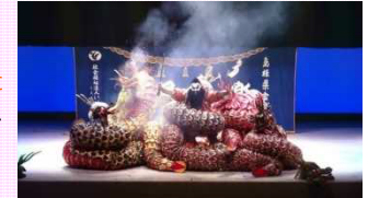
石見神楽「大蛇」(いわみ福祉会芸術クラブ)

美術、和太鼓、神楽等の日本の障害者の優れた文化芸術活動の成果を、近年、文化芸術都市として注目を集めるフランス・ナント市から世界に発信。