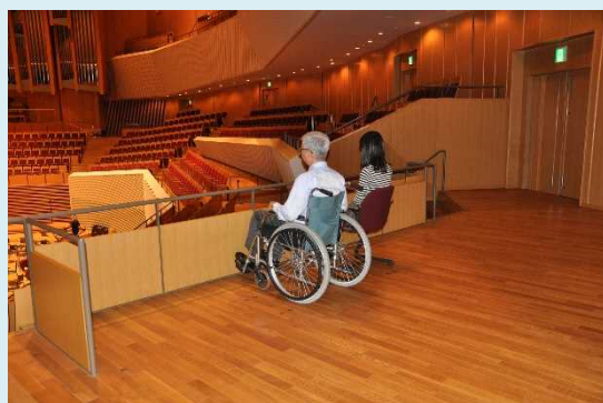
車いす用の広い鑑賞スペース・通路