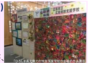
「ひろしま高文祭」での特別支援学校の生徒の作品展示

文芸、美術、音楽、演劇、伝統芸能、舞踊、演芸、障害者福祉に関するシンポジウム等を国民文化祭と同一県で開催。全国的な交流を通じ障害のある方の社会参加と障害のある方への理解促進に寄与。