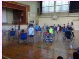
車いすダンスに挑戦する子供たち