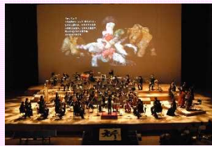
藝大アーツ・スペシャル2016 障がいとアーツ

特別支援学校の生徒と東京藝大のオーケストラとの共同制作による成果を奏楽堂で発表。障害のある子供たちも合唱に参加。また、オーケストラの中に入って音楽の振動を体感。海外からは片手ギター奏者を招聘し、障害を乗り越えてプレーヤーになった話や演奏を披露。