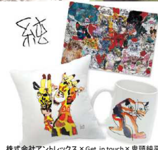
株式会社アントレックス×Get in touch×鬼頭純平

国立新美術館において障害者とアートデザインの未来をめぐる展覧会を新たな意識、新たな「生き方の創造」につながることを期待して開催。5,800名来場。