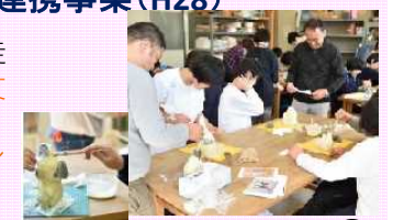
造形ワークショップの様子

美術館学芸員やボランティアとのコレクション鑑賞や、アーティストの協力を得て造形ワークショップを実施。