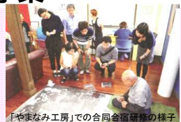
「やまなみ工房」での合同合同研修の様子

藝大生と福祉施設の利用者の共同の創作活動を通じて、支援する、支援されるという関係ではなく、作家同士、人間同士の関係を構築。