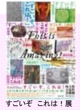
すごいぞ これは！展

障害者による優れた造形作品を発掘し、その存在を広くアピールするための巡回展(北海道、高知、広島)を実施。全国の調査研究員と事務局の埼玉県立近代美術館の館長・学芸員12人が、アーティストを1名ずつ推薦する形式を採用。