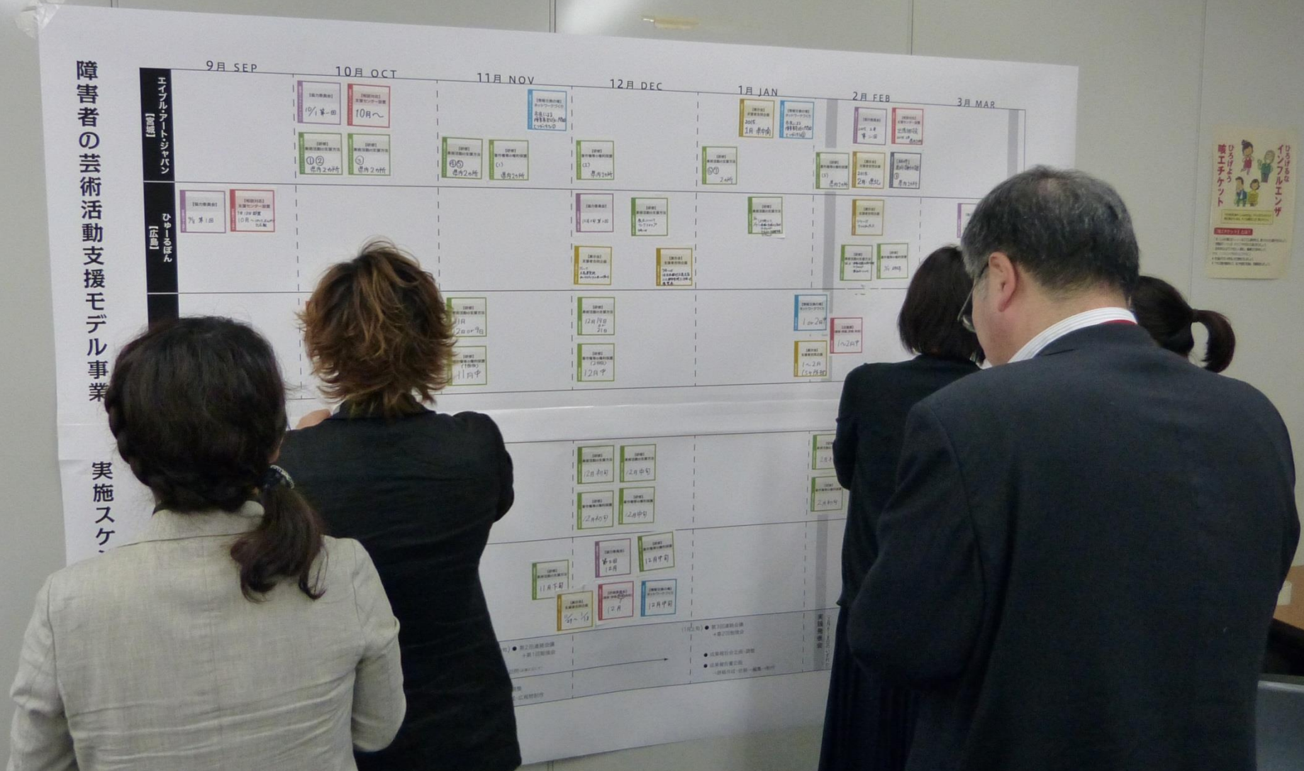
各実施団体の年間スケジュールをワーク形式で作成