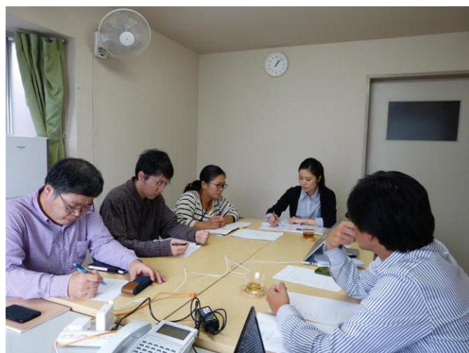
社会福祉法人愛成会(東京) 10月27日