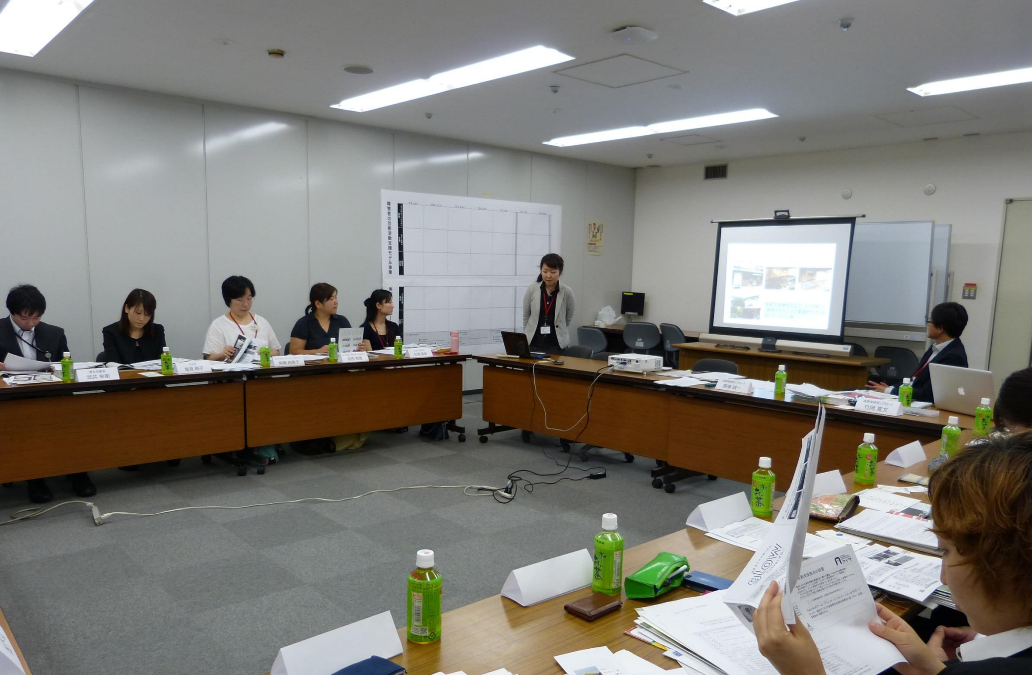
第1回モデル事業連絡会議の様子(実施団体から事業計画の発表)