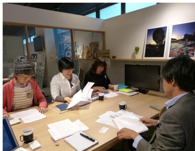
エイブル・アート・ジャパン(宮城) 10月28日