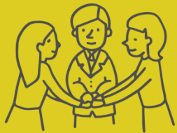
ネットワークづくり