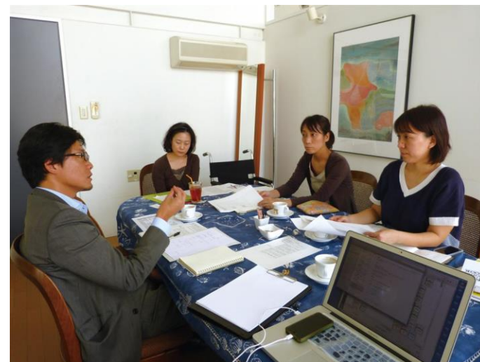
財団法人 たんぽぽの家(奈良) 10月21日